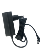
1x Adaptér DUO 14 V