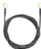
1x Kabel zemní 150 cm